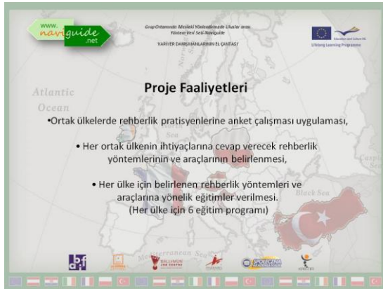
Informing the Naviguide Project' Activities