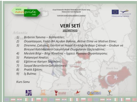
Informing the Naviguide Project' Database