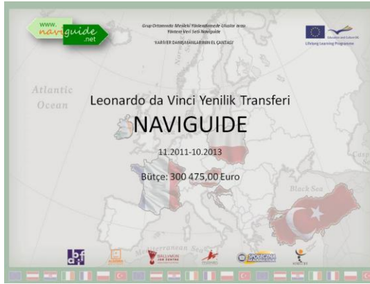
Informing the Naviguide Project