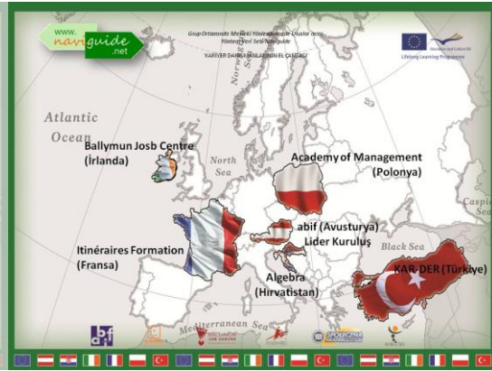
Informing the Project Partners